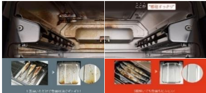
ラックを使用した場合