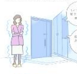
玄関・廊下の冷え込みが激しい...